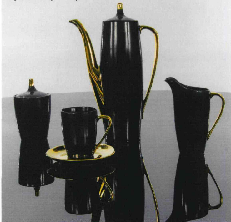
Goplana w wersji czarnej.