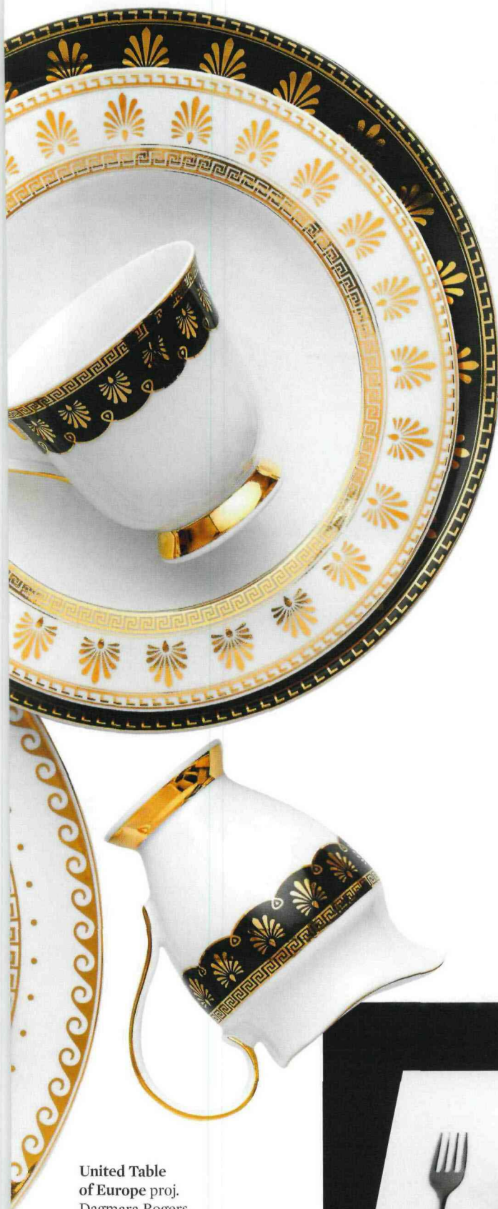
United Table of Europe proj. Dagmara Rogers, 2015 r. Klasyczne i folkowe motywy zdobnicze pochodzą z sześciu regionów Zjednoczonej Europy: Grecji, Francji, Holandii, Norwegii, Anglii i Polski.